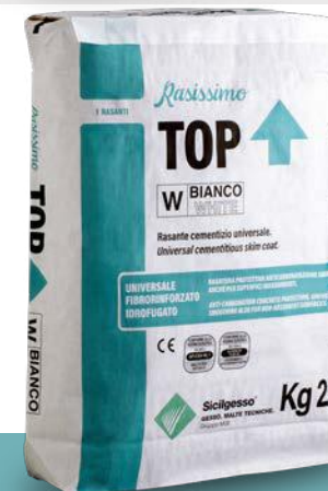
RASISSIMO TOP BIANCO/GRIGIO Evoluzione del Rasacem Top

Rasante cementizio civile idrofugato a finitura civile media.