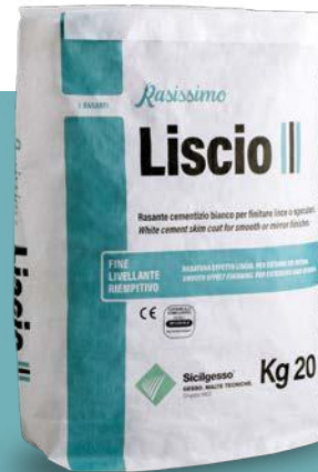
RASISSIMO LISCIO Evoluzione del Rasacem Bianco

Si adattano ad una grande varietà di ambienti, sono altamente performanti (a costi contenuti e costanti!) assicurando prestazioni elevate in ogni tipo di contesto. La linea Rasissimo dà risposta a problematiche specifiche con performance sempre più affinate ed è il risultato di un processo continuo di ricerca per sviluppare le tecniche costruttive di domani.