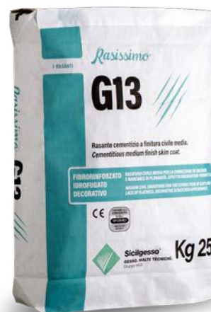
RASISSIMO G13 Evoluzione del Rasacem G

Rasante cementizio civile fibrorinforzato e idrofugato, ad elevata adesione e traspirabilità.