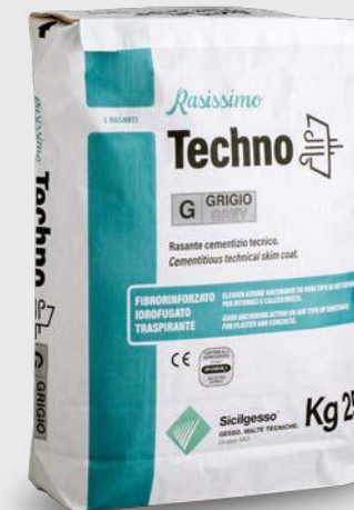
RASISSIMO TECHNO BIANCO/GRIGIO Evoluzione del Rasacem M Techno

Rasante cementizio civile fibrorinforzato e idrofugato.