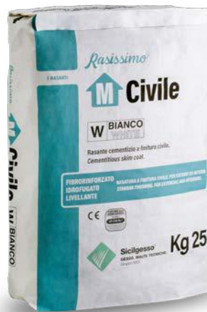
RASISSIMO M CIVILE BIANCO/GRIGIO Evoluzione del Rasacem M

Rasante cementizio civile fibrorinforzato e idrofugato.